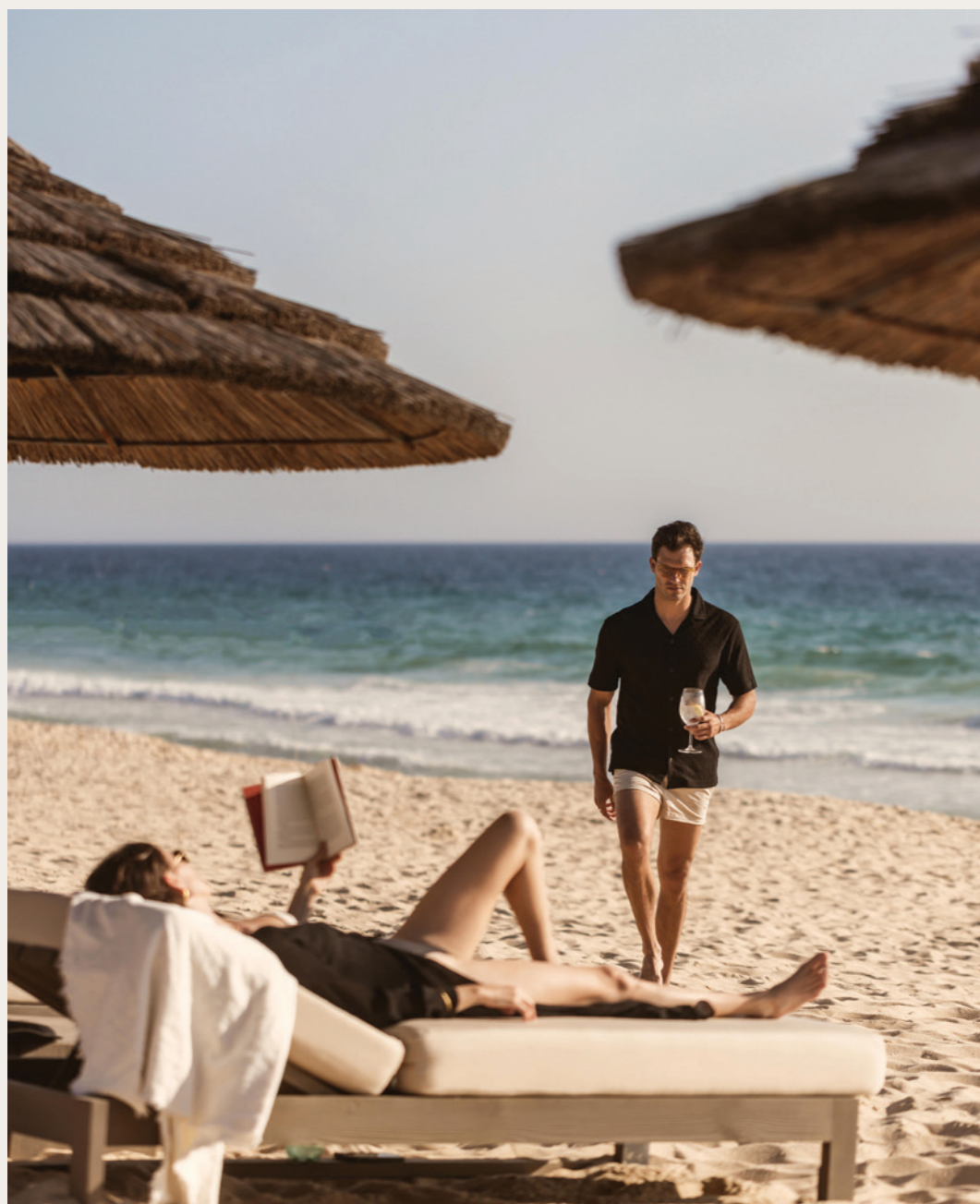
A Comporta é a sensação da areia morna nos pés, a maresia no ar e o murmúrio das ondas junto às cabanas de praia que percorrem a costa. É o sussurro do vento nos pinhais, onde natureza e o lar de fundem.