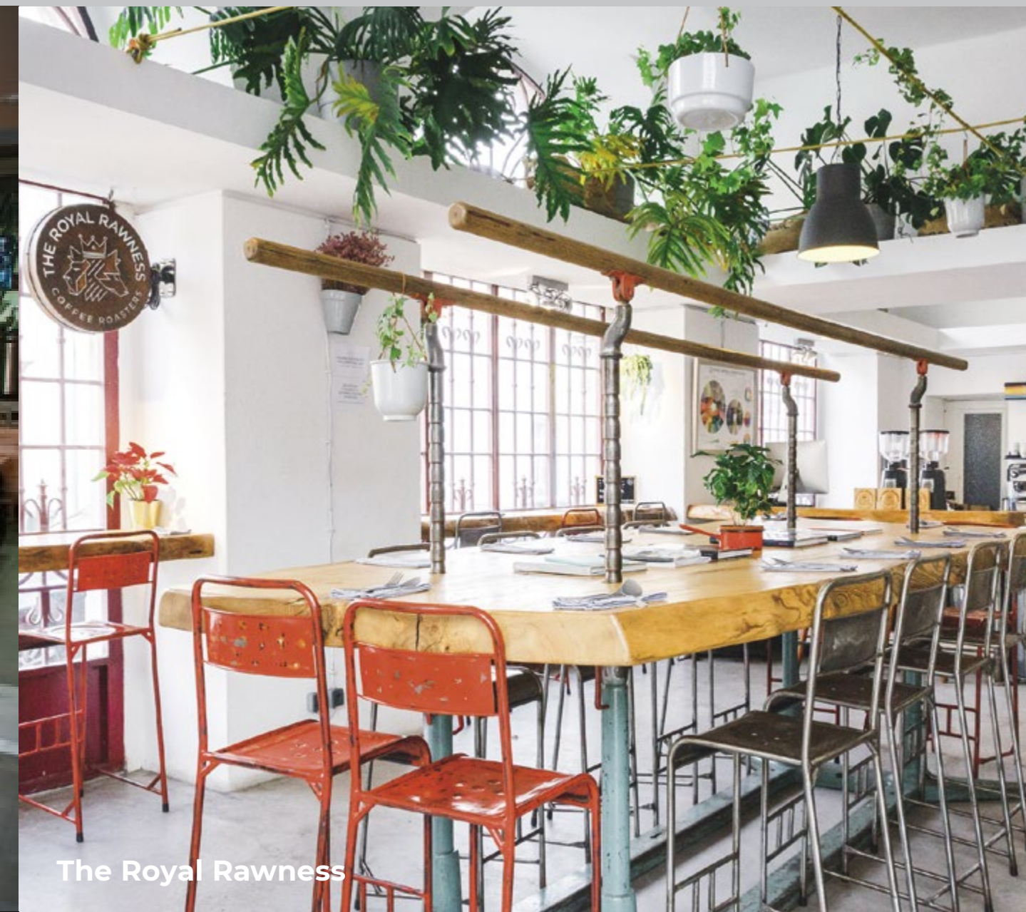
The Royal Rawness