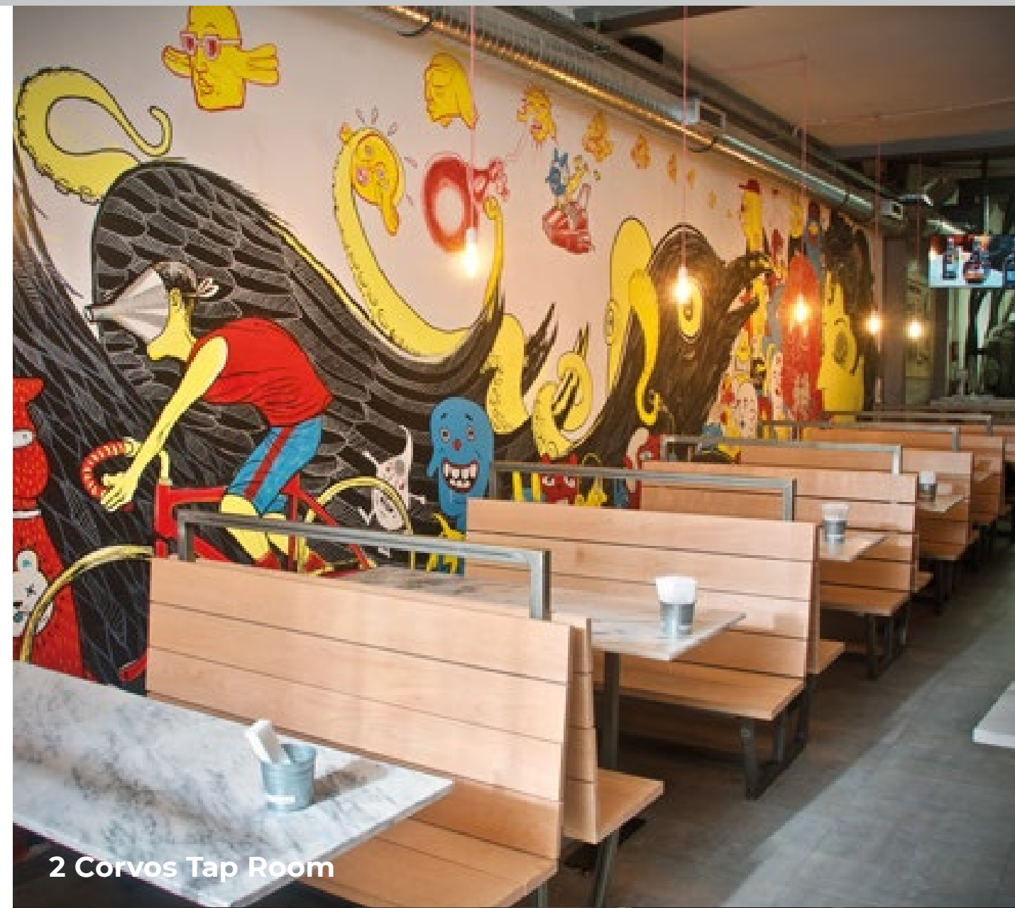
2 Corvos Tap Room

Marvila já foi um dos bairros da moda de Lisboa antes de desaparecer de cena, por momentos, apenas para se reinventar e voltar a surpreender quem vive por perto. Vizinhos, visitantes, bons vivants , todos são bem-vindos aos restaurantes de conceito, às cervejarias de autor, às galerias de arte e aos bares que as velhas esquinas revelam.