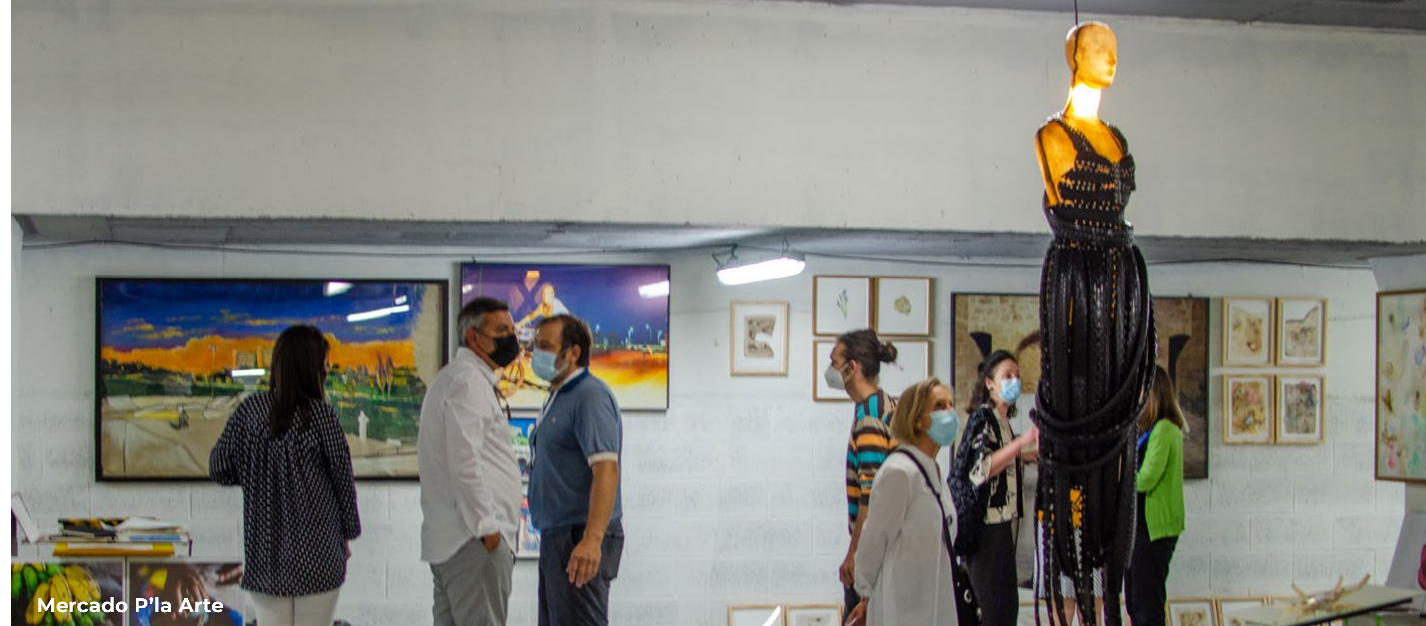
Mercado P'la Arte