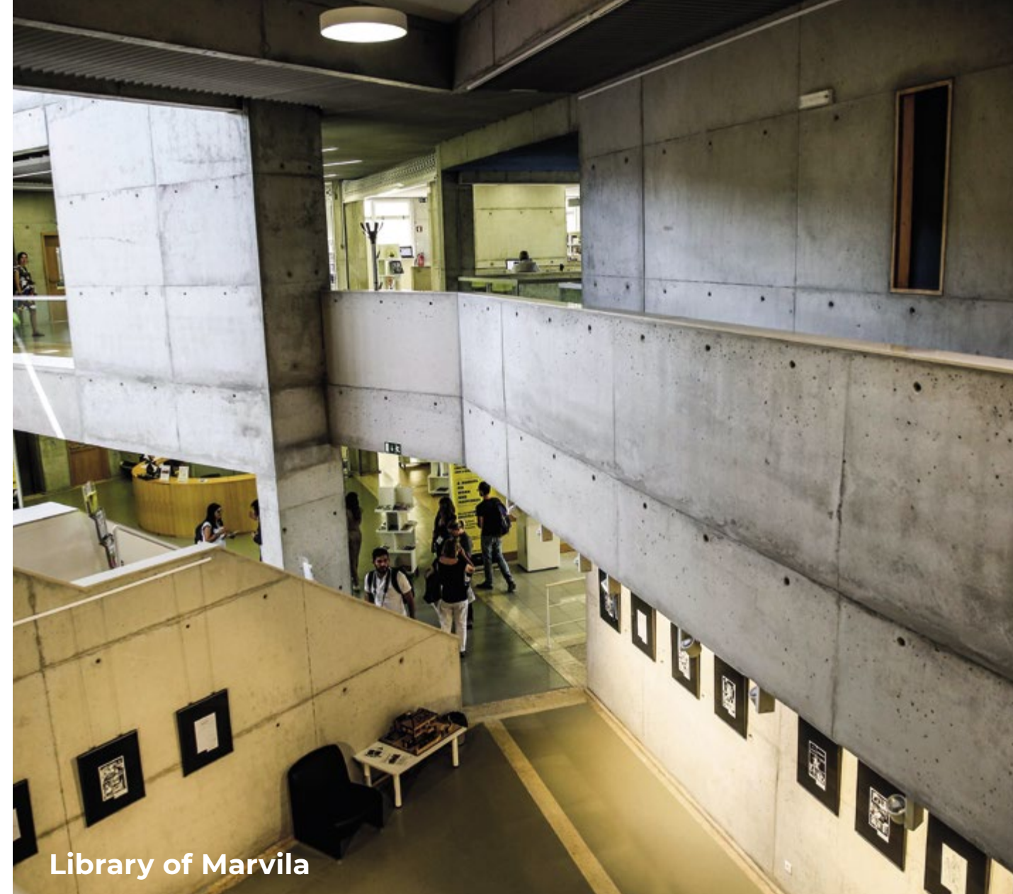
Library of Marvila