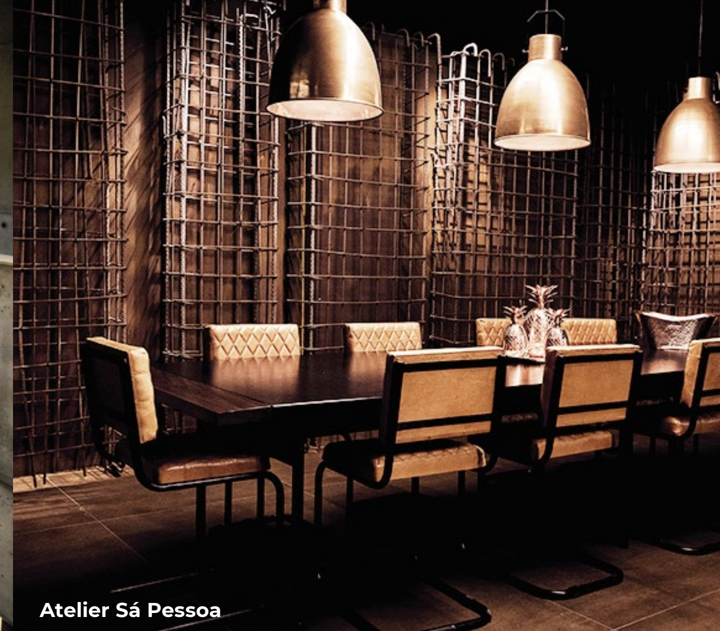
Atelier Sá Pessoa