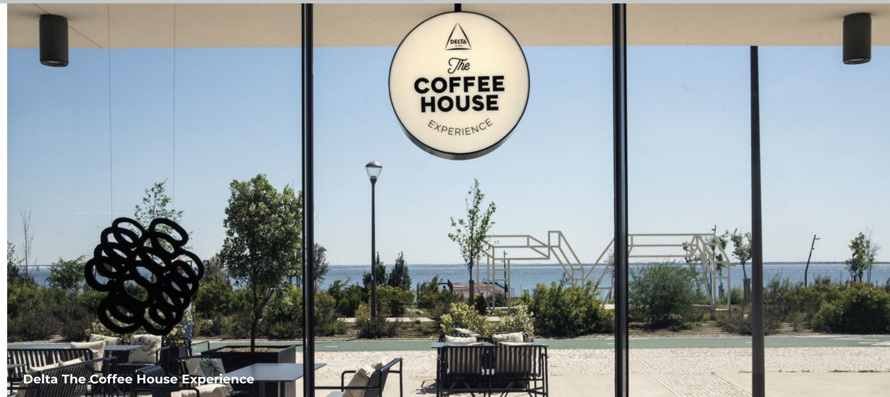
Delta The Coffee House Experience

Bem-vindo ao bairro que viu nascer o Prata Riverside Village.