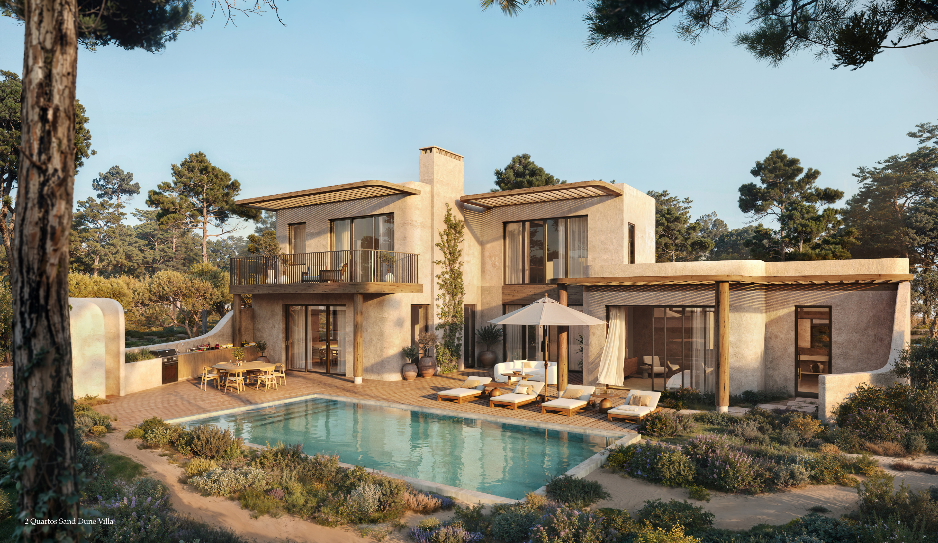
2 Quartos Sand Dune Villa