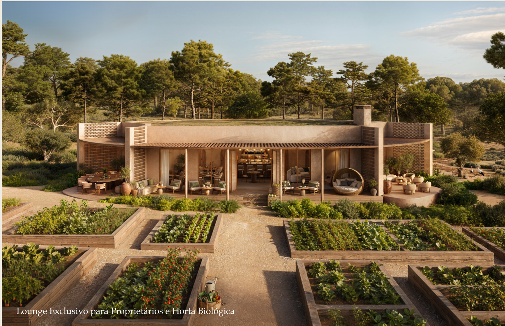
Lounge Exclusivo para Proprietários e Horta Biológica